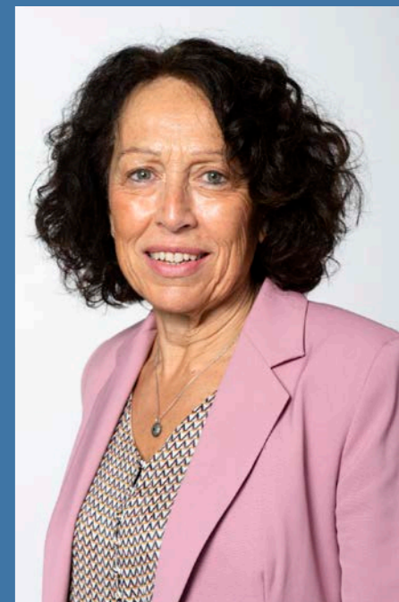
Françoise GRIVOTET Maire de Saint-Jean-le-Blanc