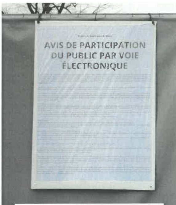
Affichage Route de Saint-Cyr