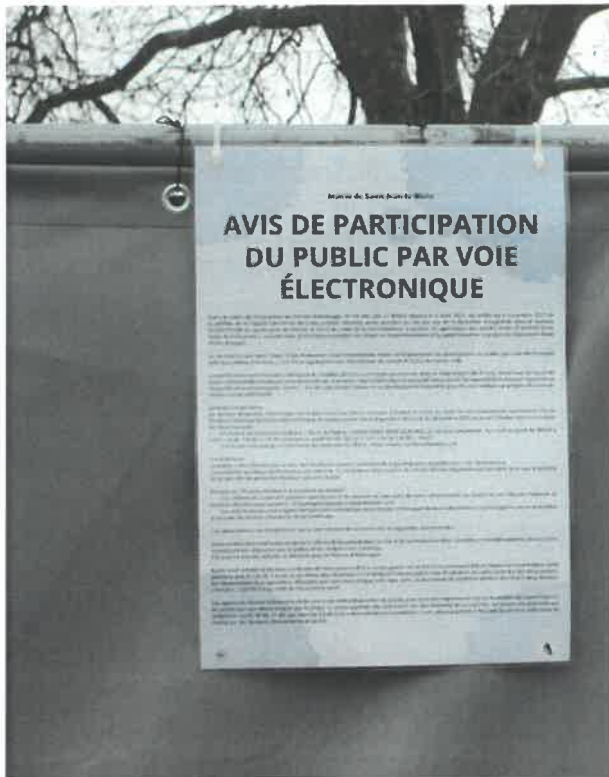
Affichage route de Sandillon